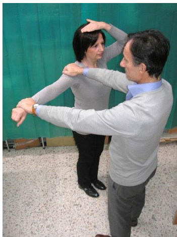
Test Chakra Corona